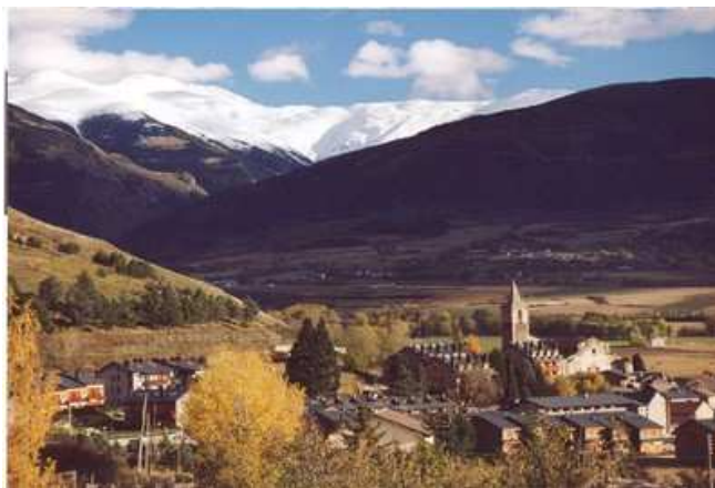
Vue panoramique de l' enclave de LLIVIA. distante de 500 mètres d'Estavar et 8km de Font-